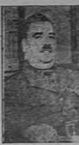
General RAFAEL NAVARRO, nuevo comandante de la primera zona militar de México...