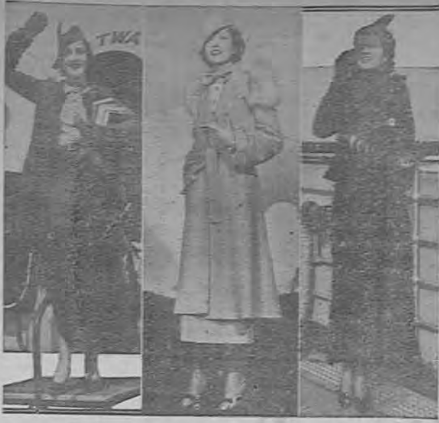
La bella estrella KAY FRANCIS luciendo tres distintos modelos de trajes de la última temporada, los cuales le han dado motivo para ser considerada como la mujer más elegante de Hollywood.

Sin embargo, Kay se ha casado cuatro veces, y aunque en todos sus matrimonios le haya ido mal, por lo menos consideramos estar de suerte eso de haber encontrado cuatro hombres que la quisieran lo suficiente para hacerle su esposa. Ya sabemos que no importa lo bonita que sea una mujer cuando se trata de encontrar marido, pues las hay preciosas que andan solteras por no haber tenido quienes las quisieran. En cuanto a eso de que la haya ido mal en sus aventuras matrimoniales, los atribuímos a que los hombres han envejecido demasiado a Kay. Ella sabe que es seductora y cree merecer toda la atención del que la ama, pero ya sabemos que en estos tiempos modernos ningún hombre se conforma a las mismas sonrisas y los mismos besos los siete días de la semana.