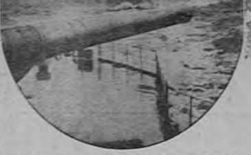
El fracaso de la colonización de Eritrea y Somalia...