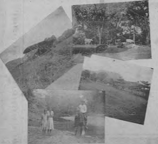
El "Pilegrin" de la Enla aterrizando en Nicoya.—Un cortejo en Caballito de Nicoya.—Quebrada Honda.—La travesía de un río.