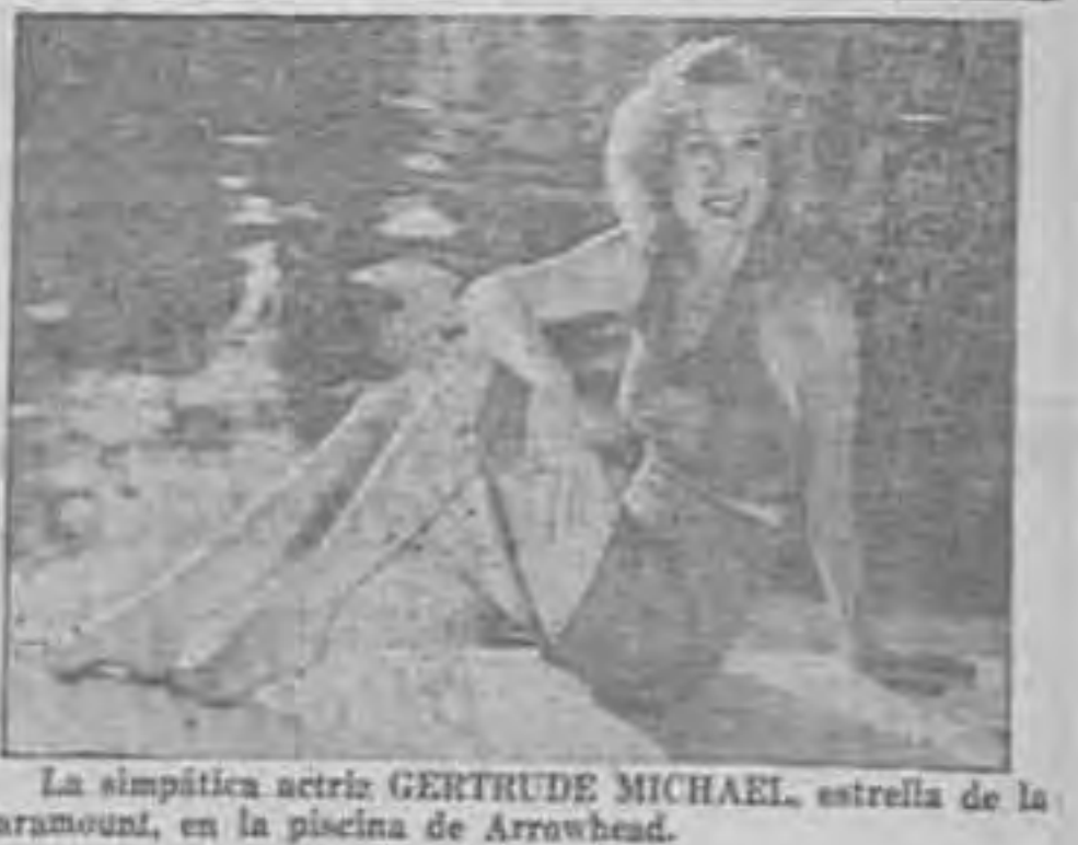
La simpática actriz GERTRUDE MICHAEL, estrella de la Paramount, en la piscina de Arrowhead.