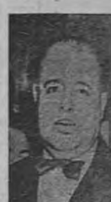
LUIS N. MORONES, el conocido líder callesista y enemigo del régimen de don general Cárdenas...