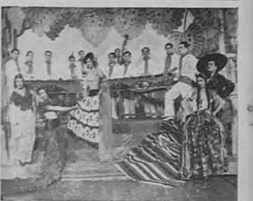
Interesantes fotografías de la marimba ATLACALT que realizó una triunfal jira por Europa. Aparecen con el conjunto de dicha marimba tres bailarinas y un tenor cubano.